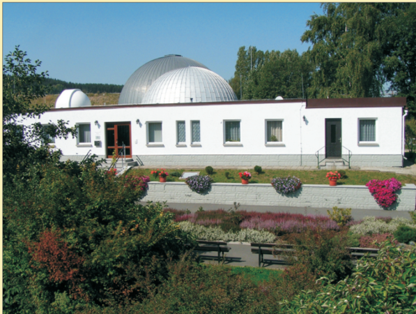
Zeiss-Planetarium und Volkssternwarte Drebach

Streckenlänge: einschließlich Planetenwanderweg / Erdgeschichtslehrpfad ca. 13,5 km.